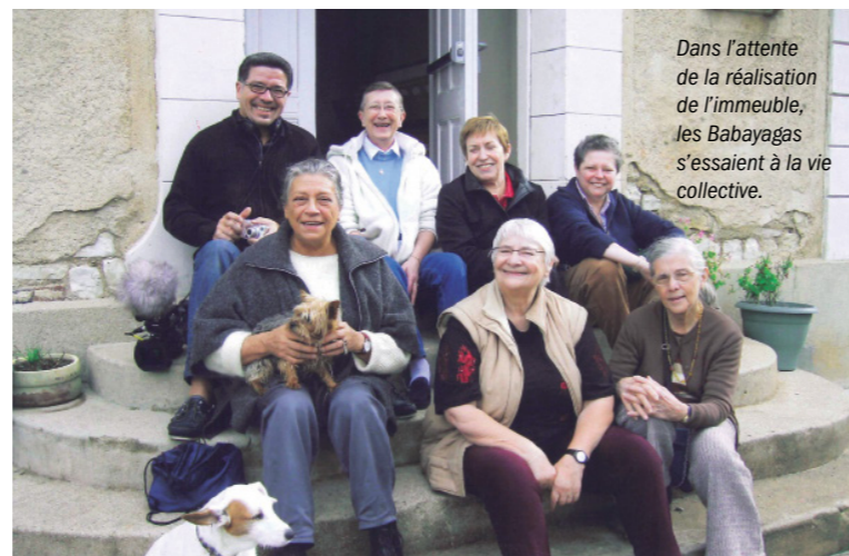
Dans l'attente de la réalisation de l'immeuble, les Babayagas s'essaient à la vie collective.

Au printemps 2004, l'équipe d'architectes désignée par concours, présente les premières études de faisabilité et esquisses. Malgré une forte mobilisation de tous les acteurs, le projet bute sur le financement du logement social hors norme . Le caractère novateur et expérimental de la proposition, bien que séduisant, effraie les pouvoirs publics au regard de sa dimension non-mixte et des modalités d'attribution fléchées des logements. La ville revient dans le projet en 2006 ce qui permet de reprendre l'initiative, de ré-enclencher la dynamique et de formuler des hypothèses opérationnelles viables pour les financeurs. Malgré cela les blocages persistent. Ce n'est qu'en avril 2008 que le projet se ré-amorce. À cette date, et après intervention directe de la Ministre du Logement, les institutions d'État revoient leur copie.